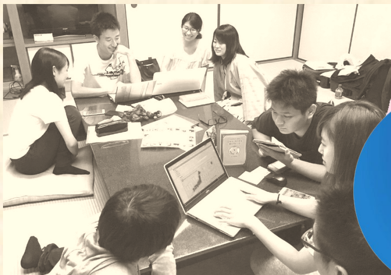
城崎温泉でイベントのプランを練る学生たち