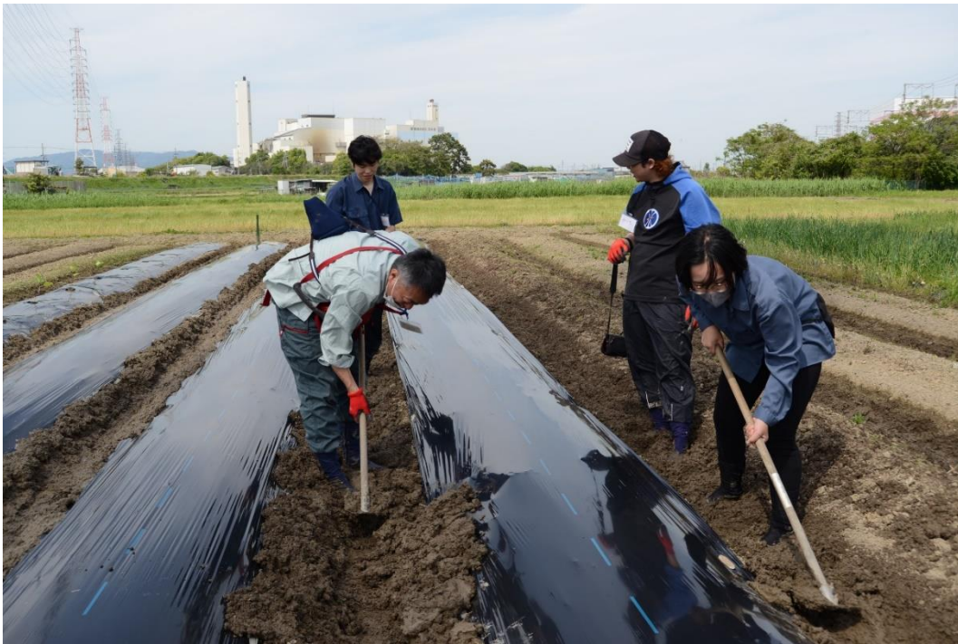
写真9 やってみると重労働であることがわかります。