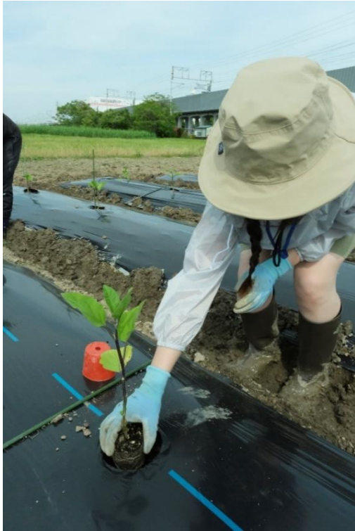
写真 15 穴に苗を植えてゆきます。