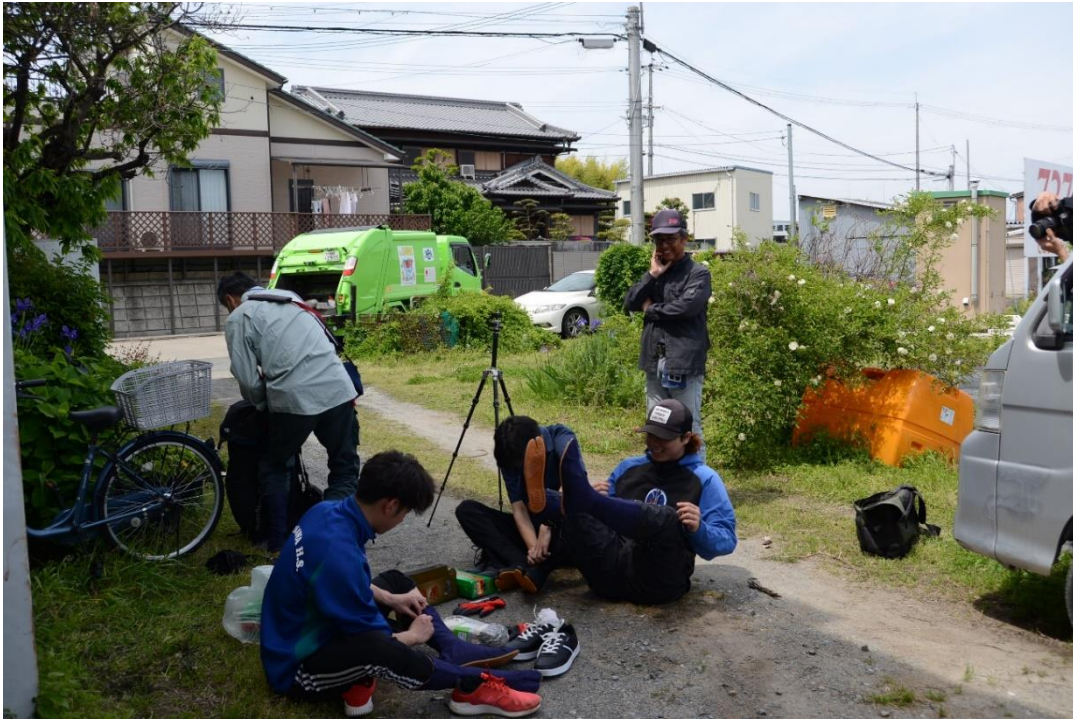
写真1 今日から畑に入っの農作業となります。男子学生たちは地下足袋にはきかえます。「だんじりみたいだ」との声も。