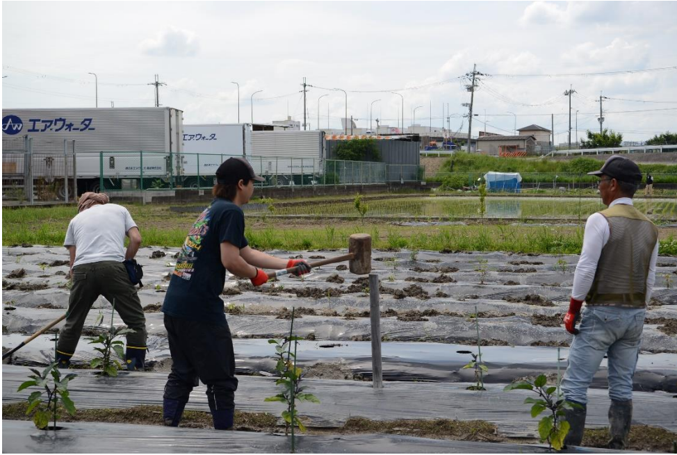
写真6 はずしました。