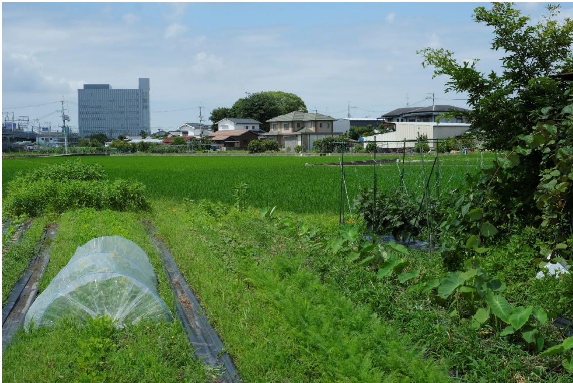
写真 22 近くの田圃も田植えが終わりました。6 月中はあちこちの田植えで忙しかったそうです。