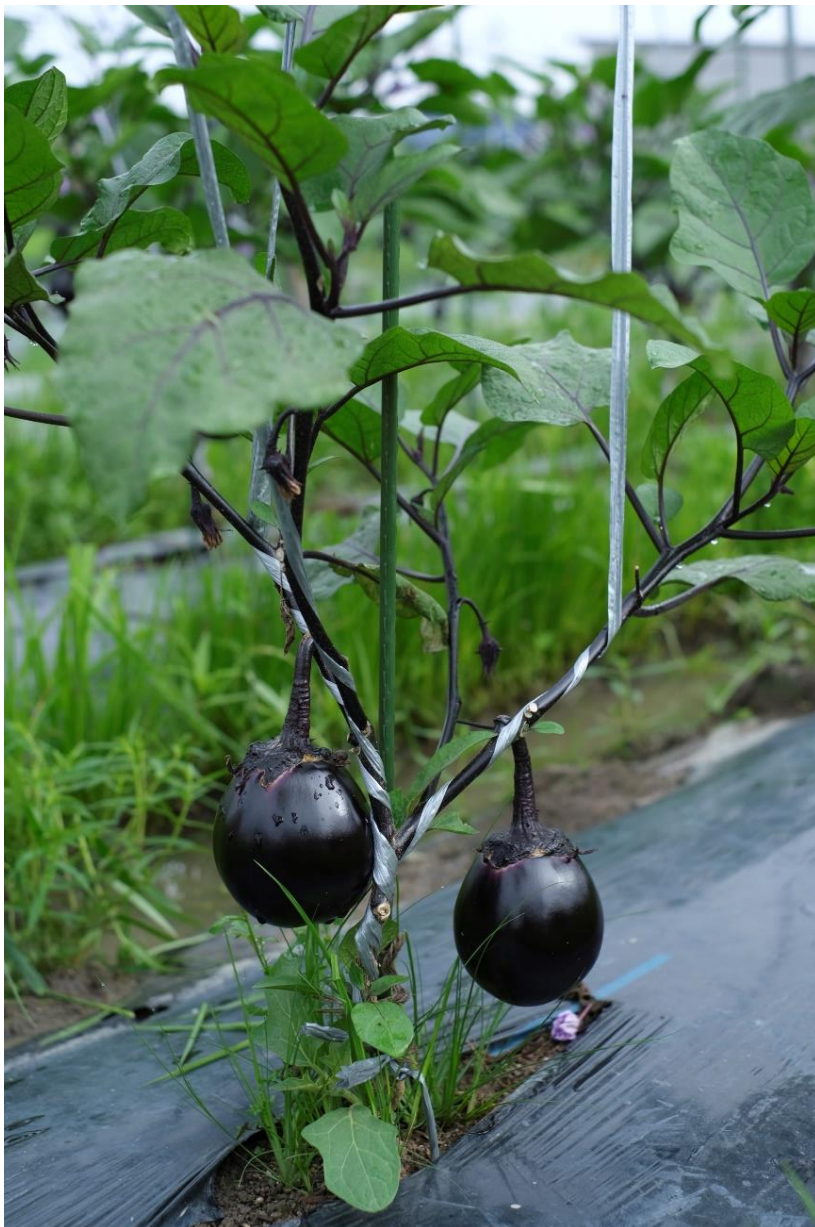
表紙写真 鳥飼なすの収穫。撮影：2023年7月2日(日)