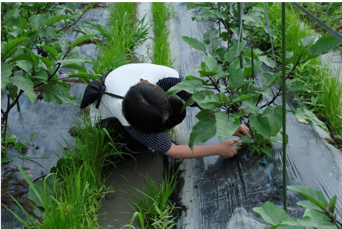
写真12 学生もやってみます。まずは台木のトルバムからです。