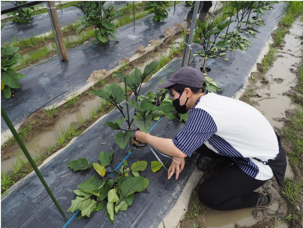
写真9 学生もやってみます。