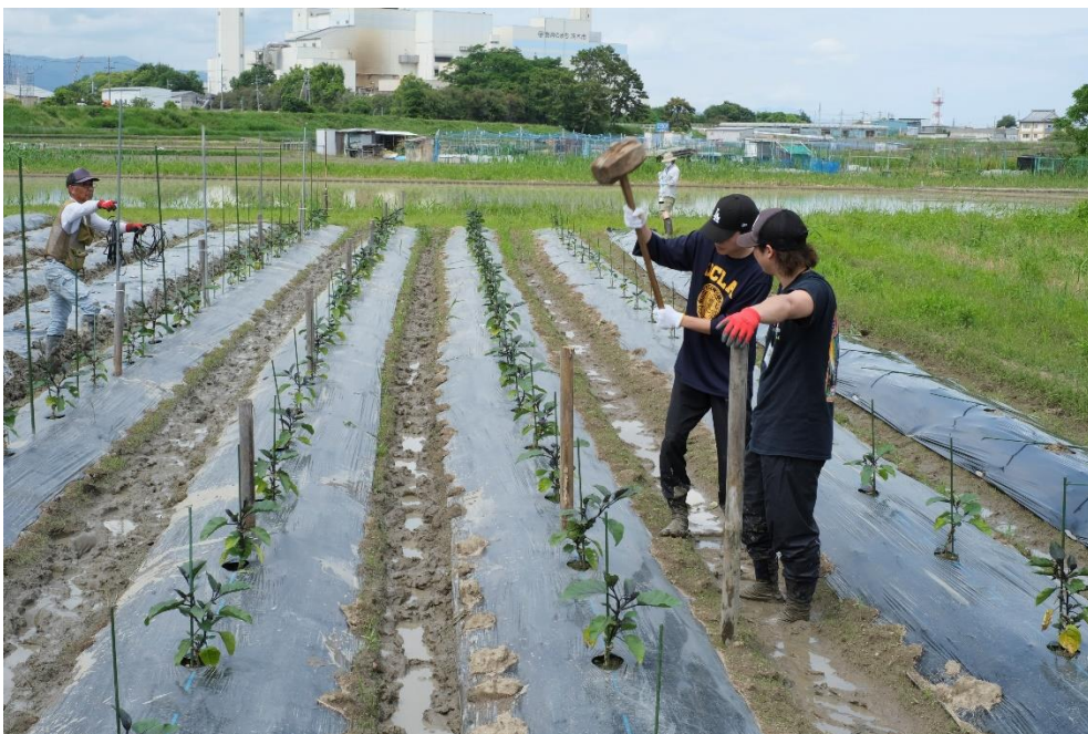
写真5 杭にまっすぐあてるのが結構むずかしいのです。