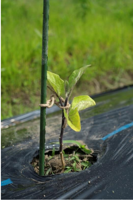
写真1 一番端の列に実生苗（みしょうなえ）を植えました。今年の春に鳥飼なすの種を植えて出た苗です。接ぎ木したあとがありません。