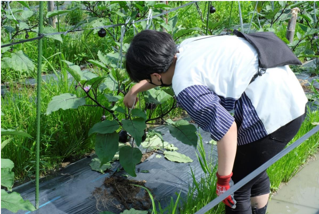
写真13 次に不要な枝葉です。枝を吊ると決めた主枝以外はぱっさりとやります。