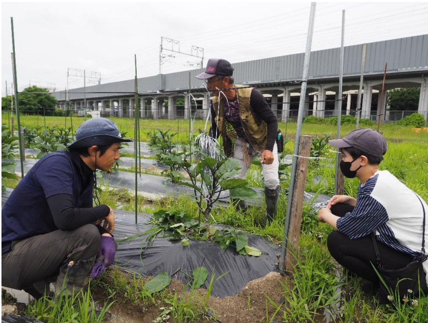
写真8 枝を吊ったテープは支柱を渡した紐に結びます。 どの枝を残すのか、生長した姿を考えるのが重要です。