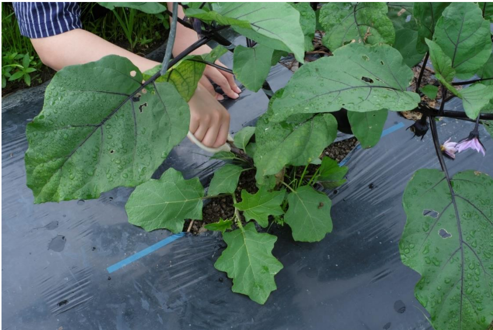
写真7 収穫後、剪定もします。陽当たりをよくするためと、なすの表面が枝でこすれて傷つかないようにするためです。前回同様、トルバムの台木から切ってゆきます。

写真6 これからは害虫とのたたかいです。6月22日にダニが湧いて消毒をしたそうです。その時に追肥もしたとのこと。極力消毒はしたくないのですが、被害を食い止めるためには最低限はせねばならないそうです。テントウムシダマシとかこれからいろんな虫がどんどん湧いてきます。蒸し暑いとよく虫が出て来るそうで、ほぼ毎日観察しないと、葉の後ろに卵を産んできます。