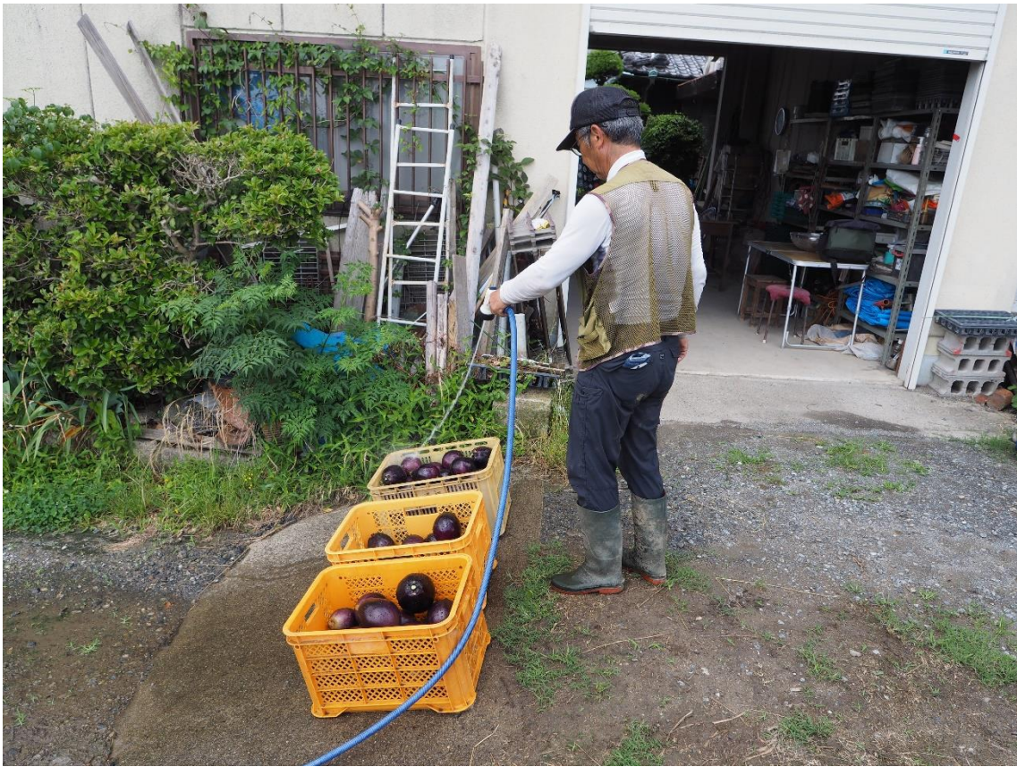
写真 16 家に持ち帰り、コンテナごと洗浄します。