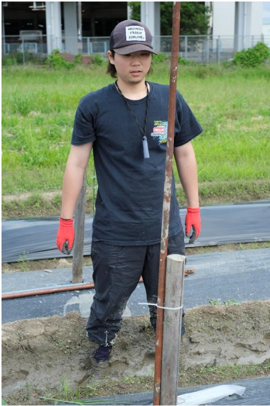
写真9 結束バンドで鉄パイプを杭に固定します。