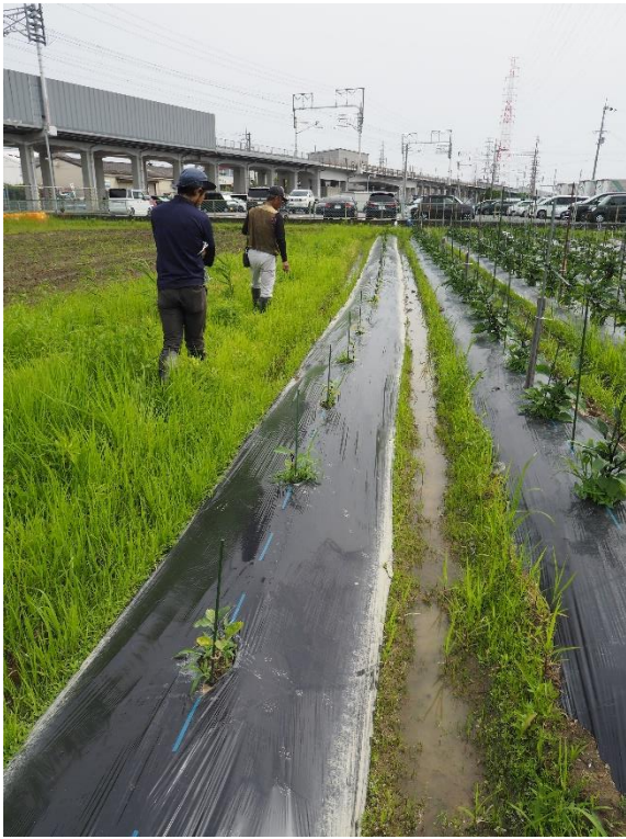
写真1 実生苗（みしょうなえ）も生長しています。