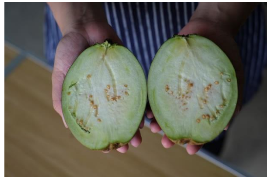
写真19 中を割ると、種も詰まっております。