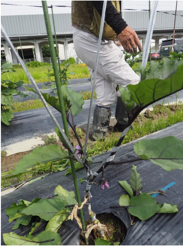
写真7 ビニールテープで下から枝を吊ってゆきます。