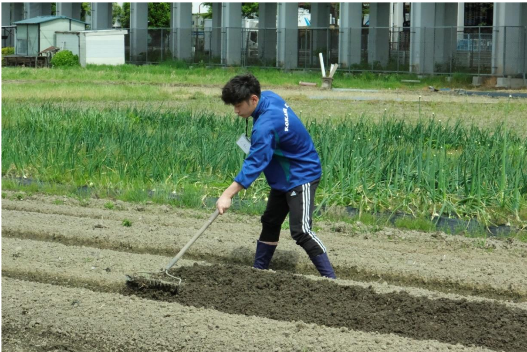
写真4 まず、畝（うね）を整地します。すでにトラクターで畝をたててあります。