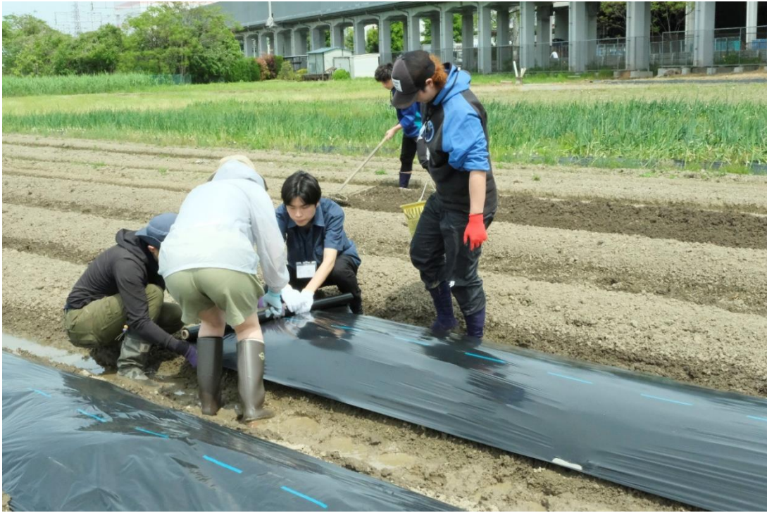
写真5 次にマルチのシートを張ります。