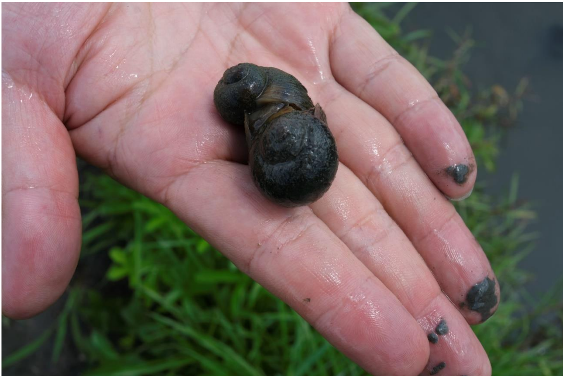
写真 24 これがジャンボタニシです。ある程度稲が生長すると、ジャンボタニシは稲を食べなくなり、田圃の害虫を食べてくれます。なので、うまくつきあうと頼もしい存在なのです。でも、気候変動で生長時期に気温が高くなると、被害が大きくなります。