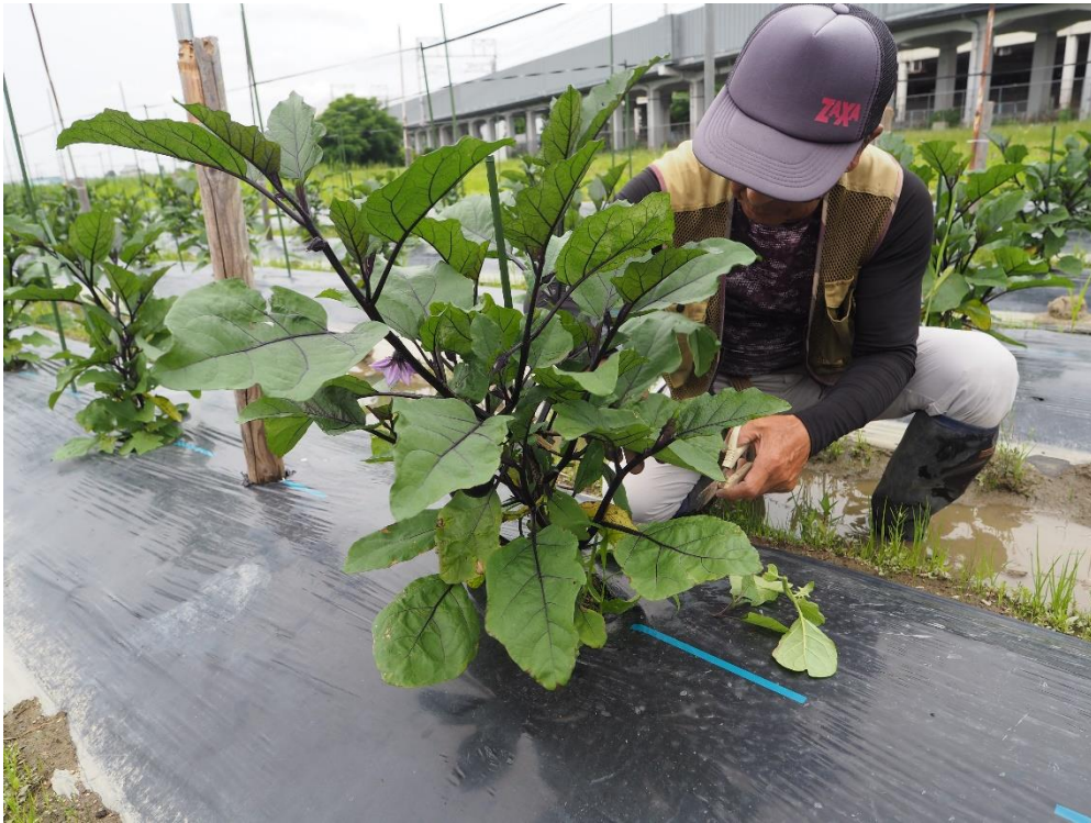
写真3 まずは下の方からぱっさりと。脇に伸びる枝から落とします。