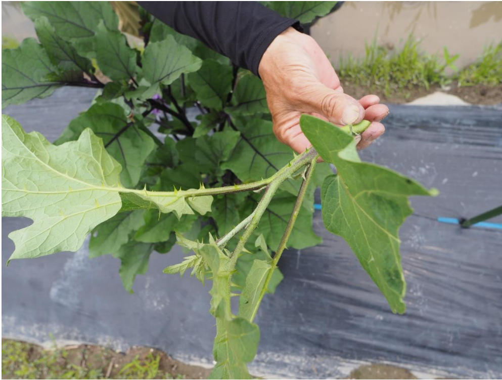
写真5 台木のトルバムの枝です。トゲがあるので要注意です。