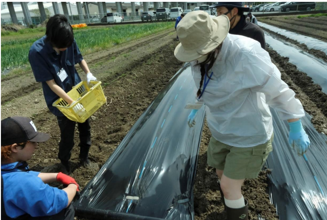
写真6 1.5m 間隔で両脇にペグを打ってゆきます。