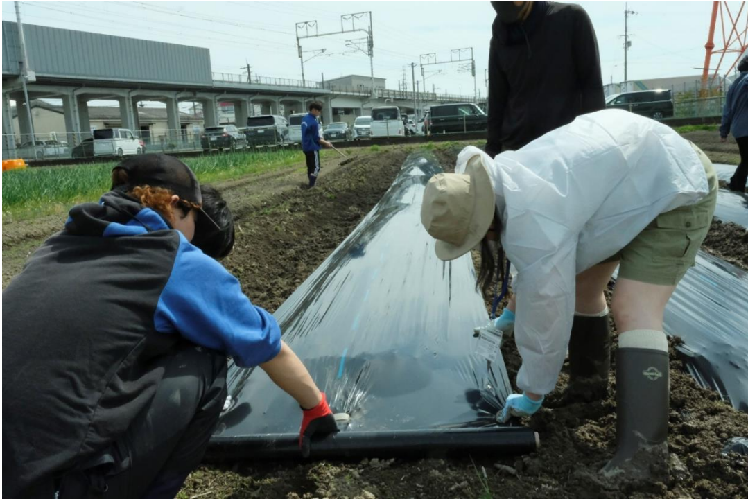
写真7 まっすぐ張っているつもりでも、結構曲がってしまいます。遠くを見ながら張るのがコツです。