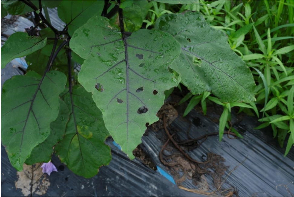
写真6 これからは害虫とのたたかいです。6月22日にダニが湧いて消毒をしたそうです。その時に追肥もしたとのこと。極力消毒はしたくないのですが、被害を食い止めるためには最低限はせねばならないそうです。テントウムシダマシとかこれからいろんな虫がどんどん湧いてきます。蒸し暑いとよく虫が出て来るそうで、ほぼ毎日観察しないと、葉の後ろに卵を産んできます。