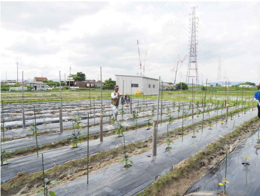
写真11 支柱の間にテープを渡してゆきます。