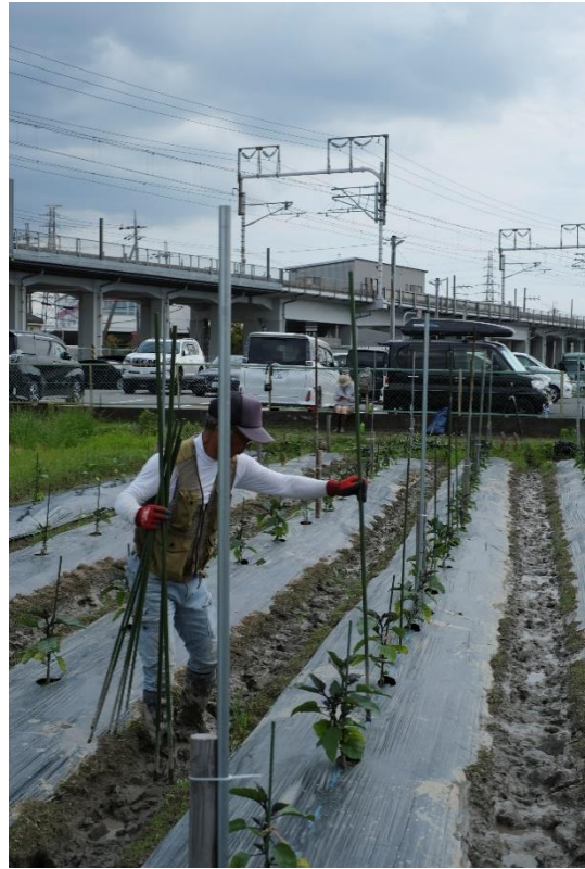
写真10 杭と杭の間にも支柱を立てます。