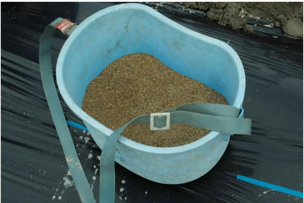
写真 14 肥料は油かすと米ぬかを 1:1 で混ぜたものです。