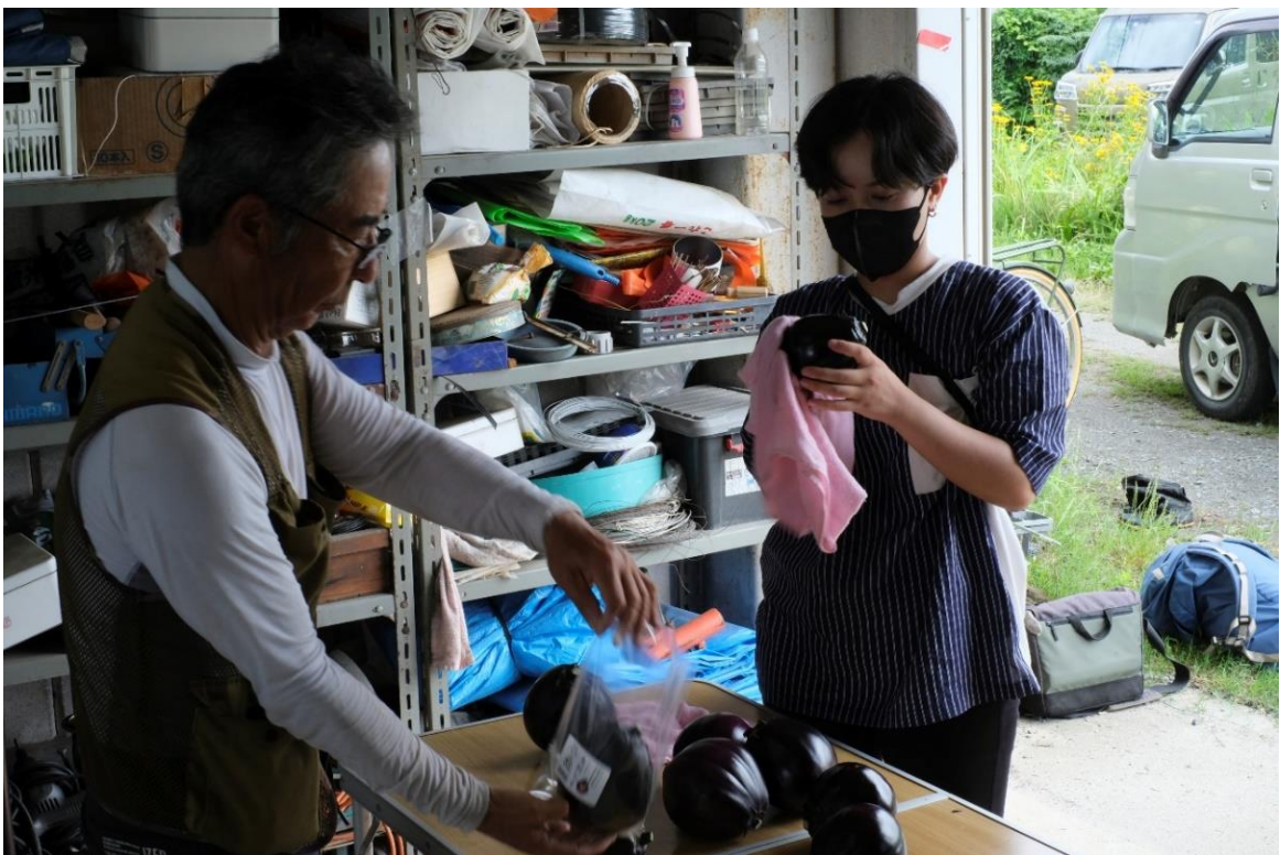
写真20 1個ずつよく拭いて袋詰めになります。