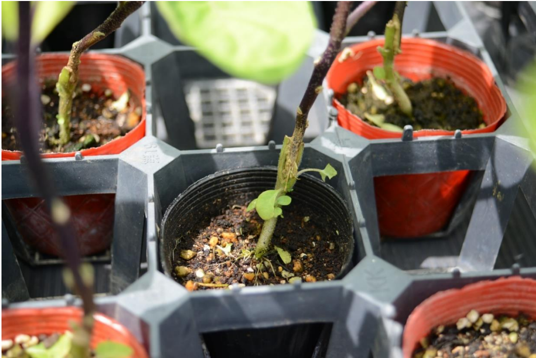
写真3 接ぎ木した部分もちゃんと活着しています。