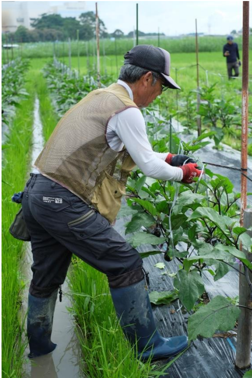
写真10 枝も吊り直しておきます。 特に実のついたあたりは重さを支えられる ように念入りに吊っておきます。