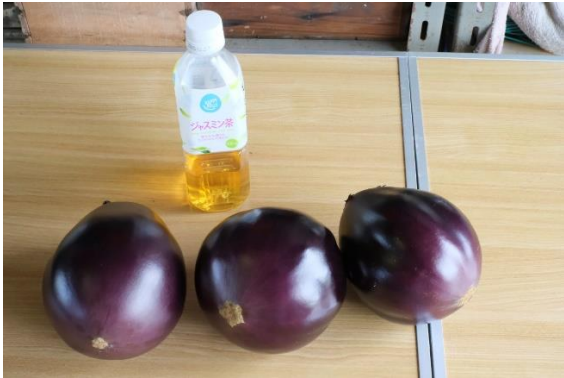
写真18 サイズ観わかりますか？