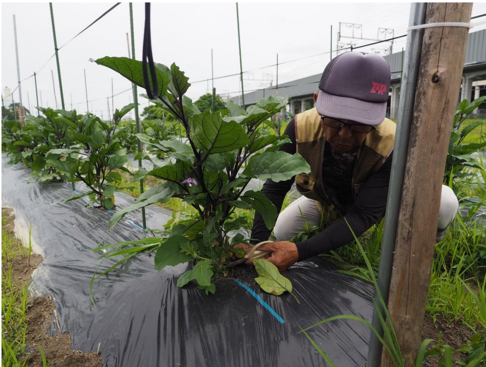
写真2 今日は剪定です。不要な枝葉を切ってゆきます。