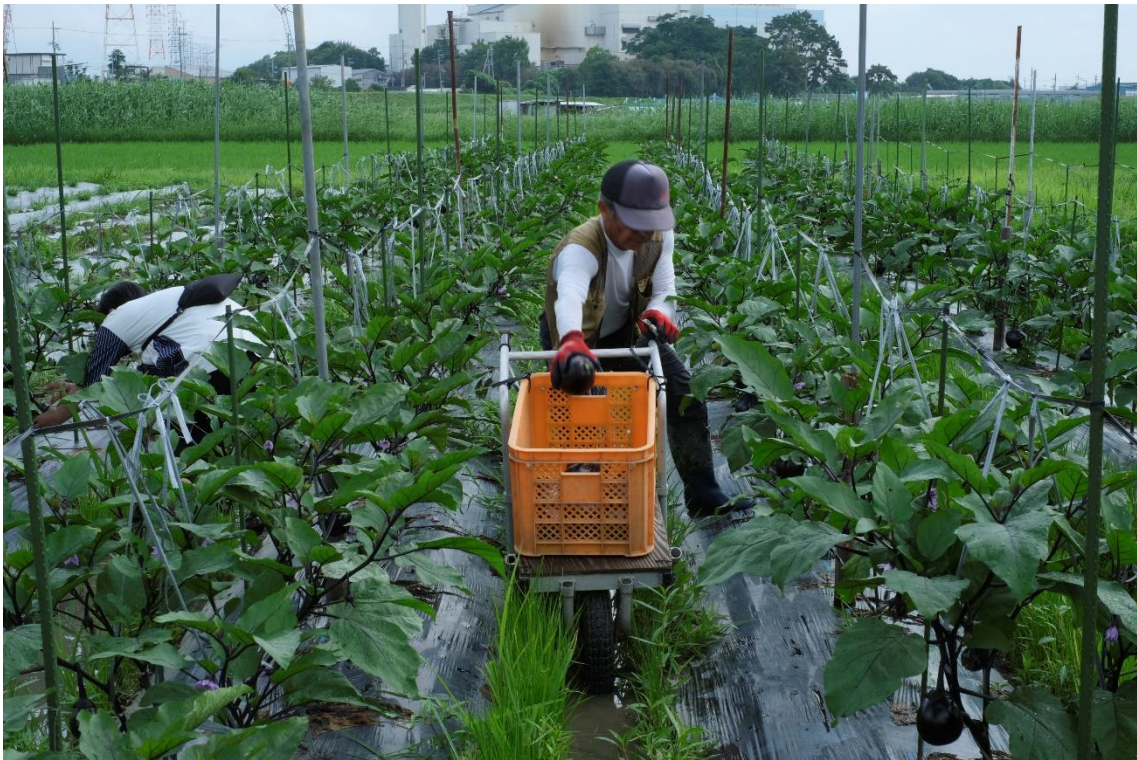
写真4 一輪車にコンテナを取り付けてバンドで固定しています。