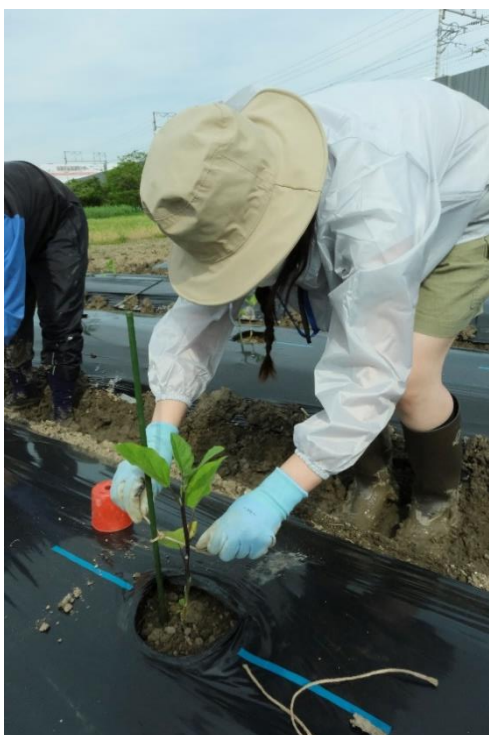
写真 19 一度結んだら苗までよじってゆきます。 葉や芽が支柱に接触しないように支柱と苗の間隔をあけます。