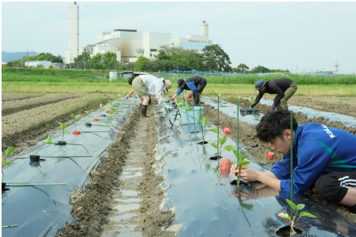
表紙写真 鳥飼なすの植付。撮影：2023年4月27日（金）