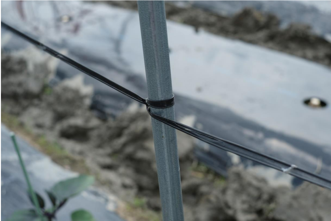
写真12 鉄パイプの支柱には左から右へ1回巻き付け、上から下へ持ってきて、殺します。