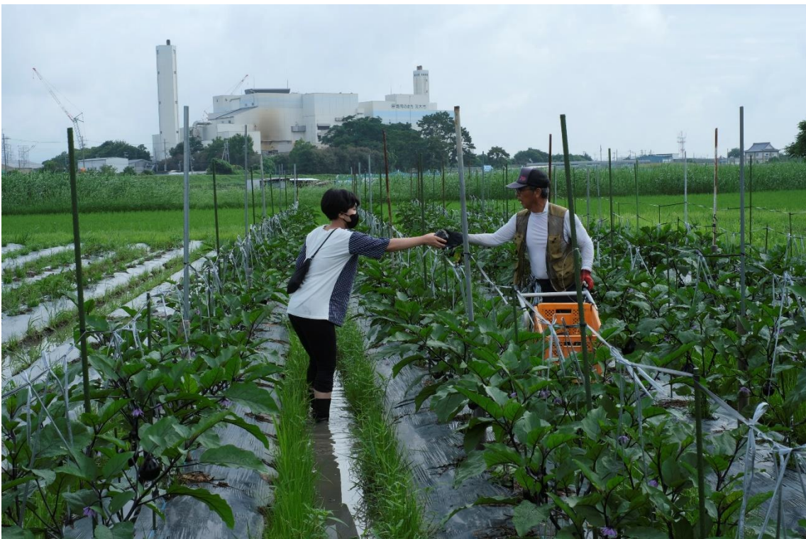
写真3 畑に入って収穫します。足場が悪いのでコンテナが大活躍です。