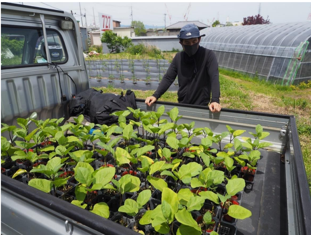
写真2 苗もすっかり大きくなりました。