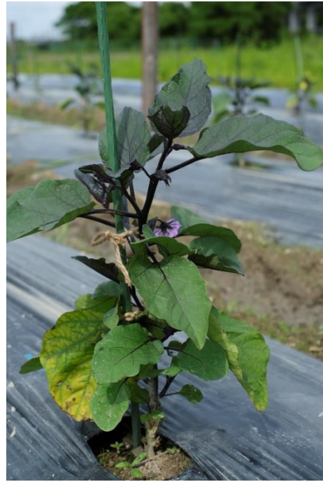
写真2 こちらは接ぎ木した苗です。もう 30cm 近くまで生長しました。花が咲いているのがあります。