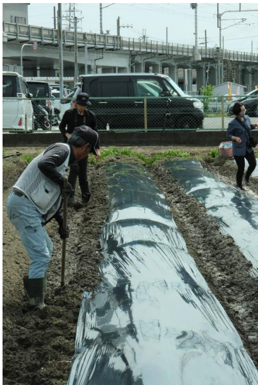
写真8 畝の谷間の土を寄せてマルチが風で飛ばないように固定します。