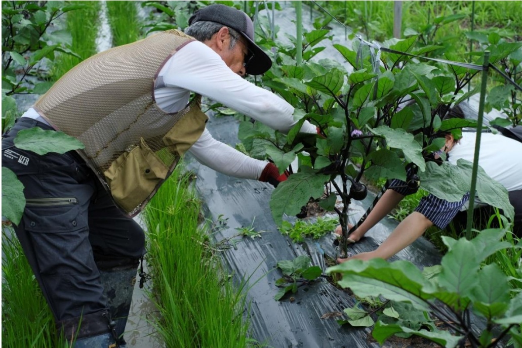
写真8 あれだけ剪定したのに2週間でさらに枝葉が茂ったのがわかります。