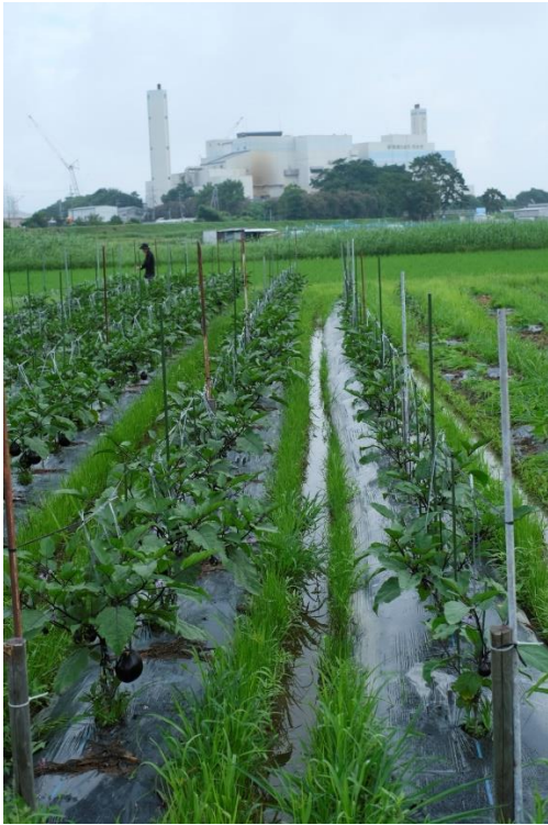
写真1 今年の初出荷を迎えました。