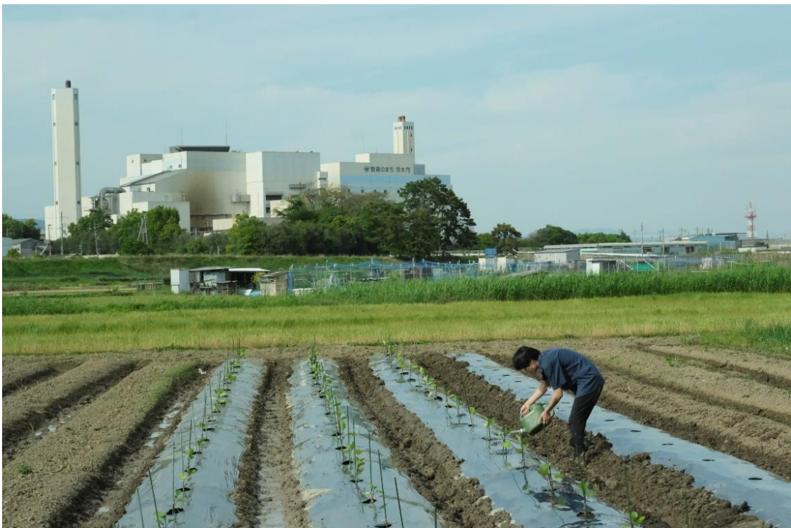
写真 22 最後に苗に水をあげて今日の作業は終了です。