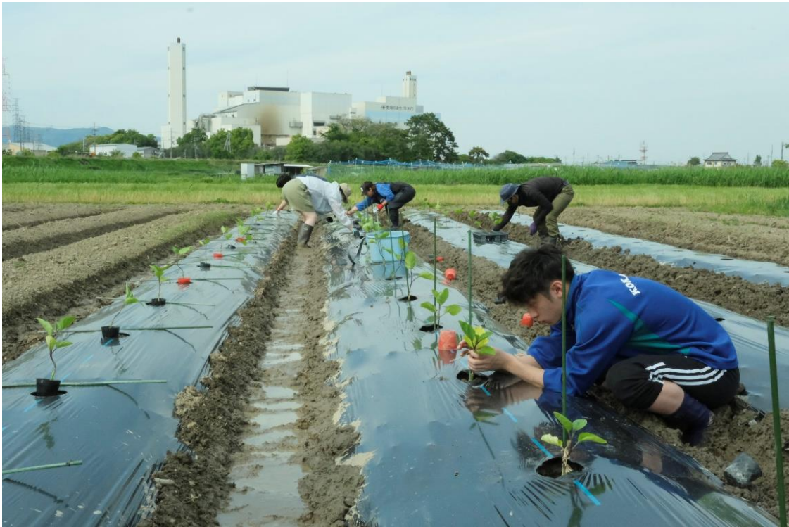
写真 21 昨日や一昨日の雨を吸って田圃の土はぐちゃぐちゃです。鳥飼なすは低湿地で水はけの悪い田圃で作ります。水を必要とする鳥飼なすにはこういう所が向いています。