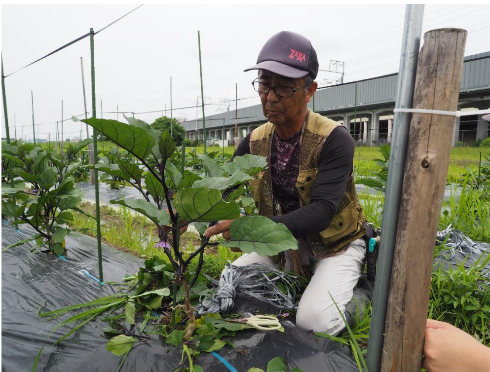
写真4 主要な枝を3-4本のみ残します。