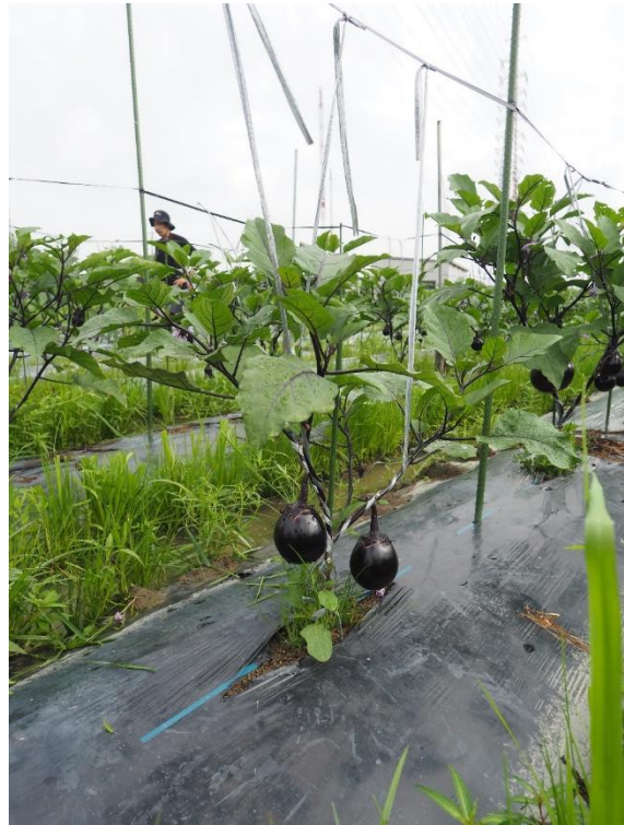
写真2 大きな実がぶらさがっております。