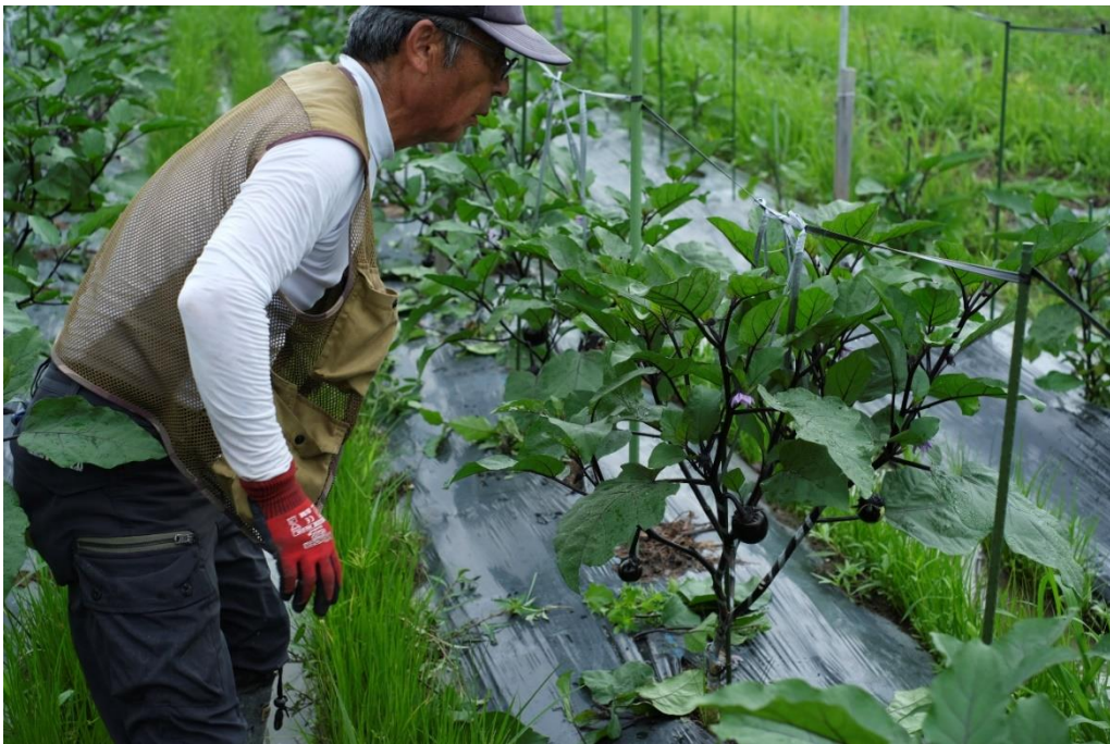
写真9 とりあえず、下の方はすっきりしました。