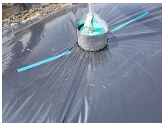
写真10 苗を植える穴を開けてます。 写真11 先端がギザギザになっております。