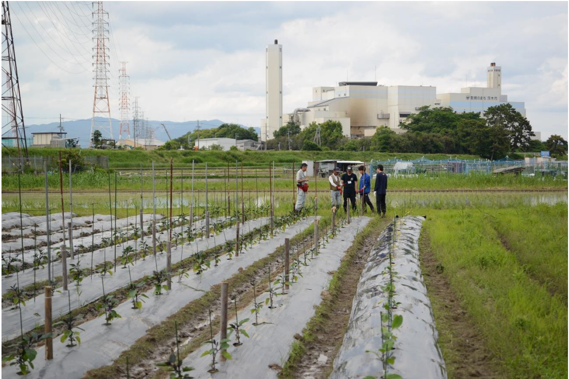
写真 14 あとはこの繰り返しです。