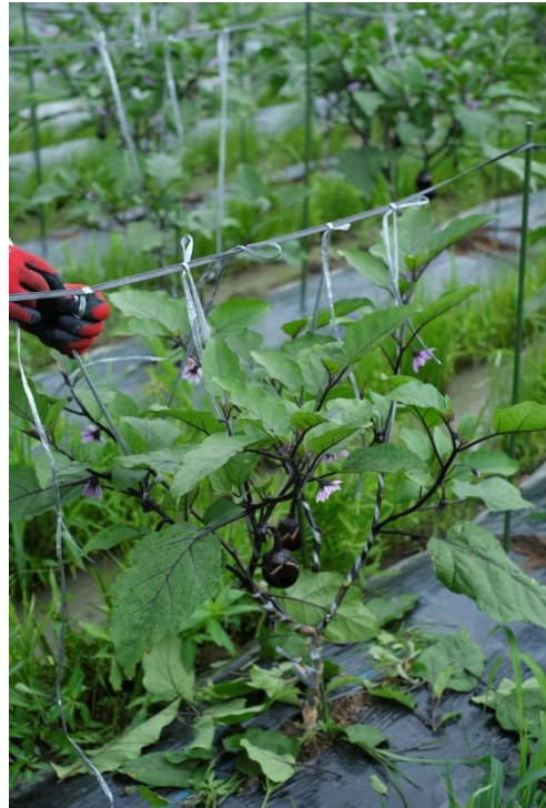
写真11 上の部分はすぐ着脱できるよう に止めておきます。こうすれば、生長に応 じて何度でも吊り直しできます。