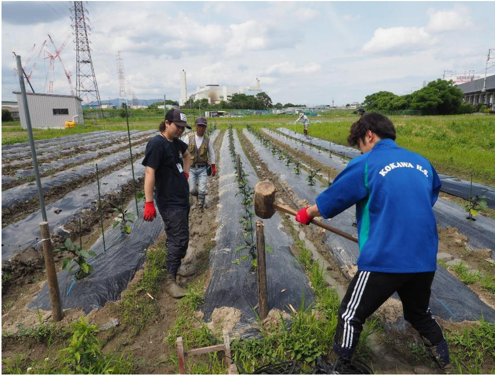
写真4 さっそくやってみましょう。