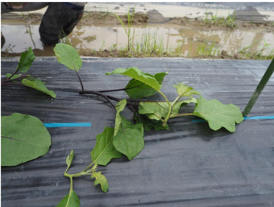
写真6 こちらは鳥飼なすの枝です。なすにも先端にトゲがあります。根元に近い太い枝にはありません。トゲは植物が弱い部分を身を守るためにあるのがわかります。