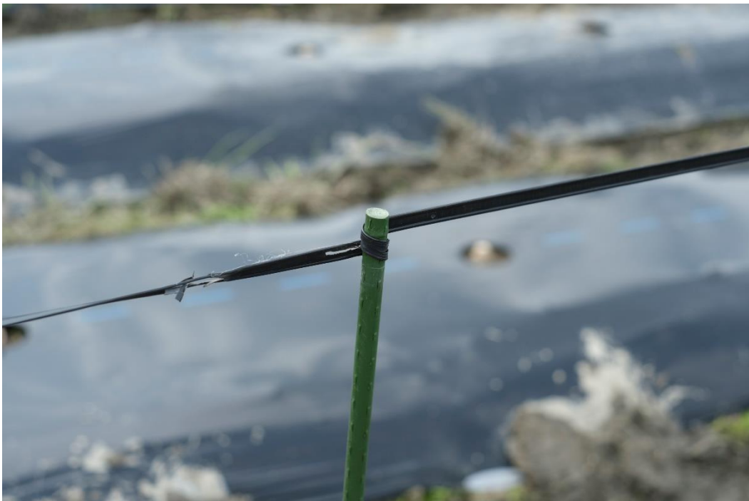
写真13 プラスチックの支柱には、左から右へ巻き付けるだけにします。