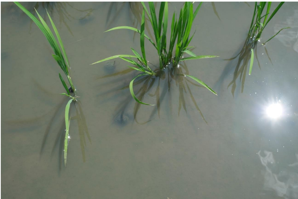
写真 23 今年気温が高かったため、ジャンボタニシによる食害がひどかったそうです。稲が小さいうちはジャンボタニシが苗を食べてしまうのだそうです。