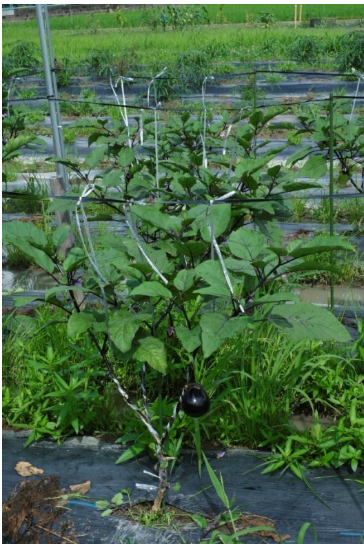
写真14 「ちょっと切りすぎですかね？」 「ええねん。すぐ伸びてくるから」