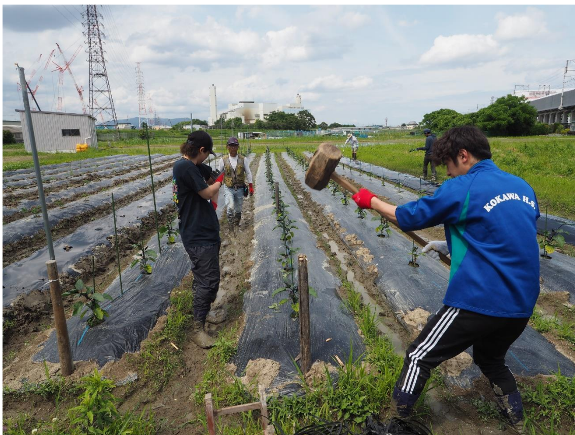
表紙写真 鳥飼なすの支柱立て。撮影：2023年5月26日(金)