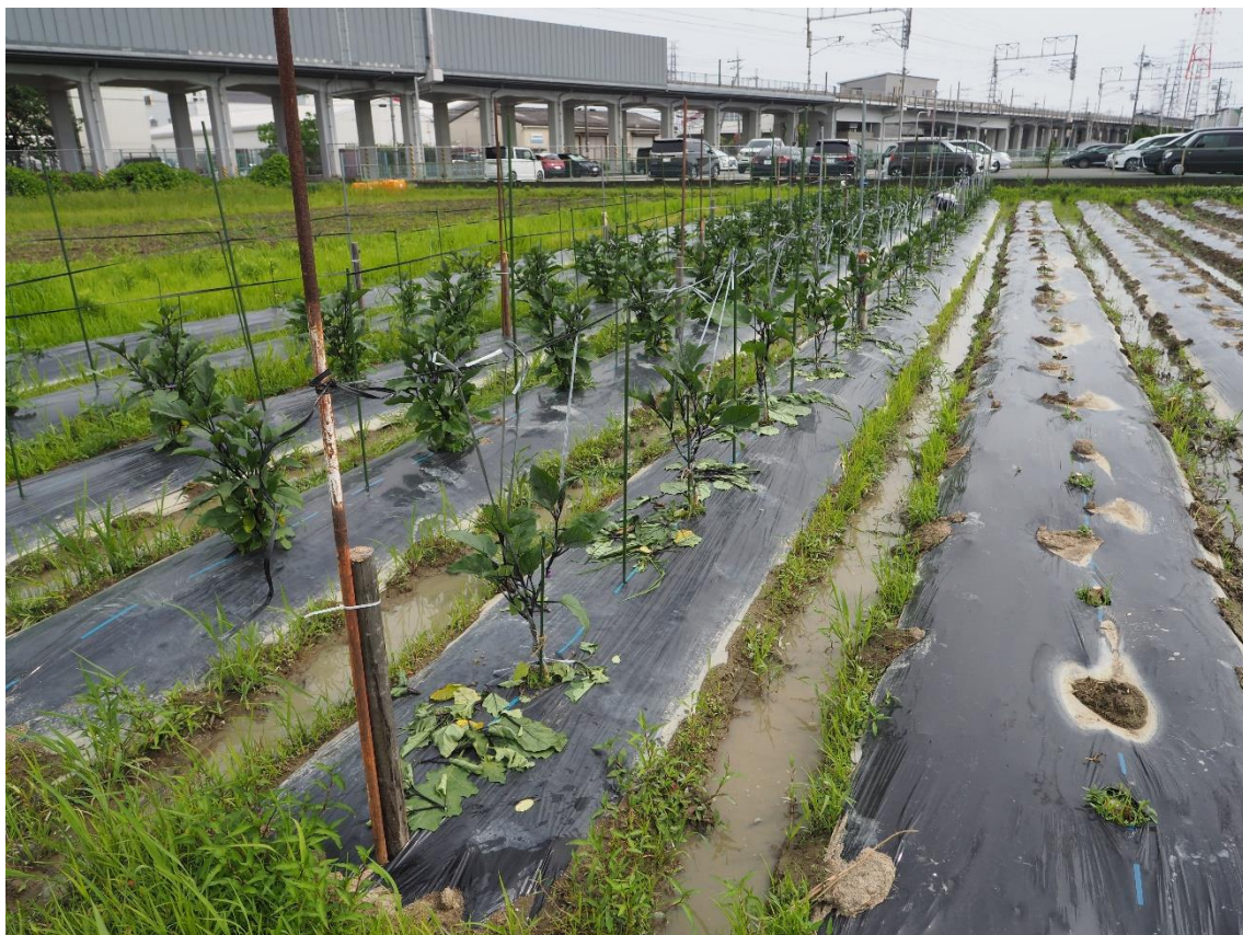
表紙写真 鳥飼なすの剪定・枝吊り 2023年6月10日(土)