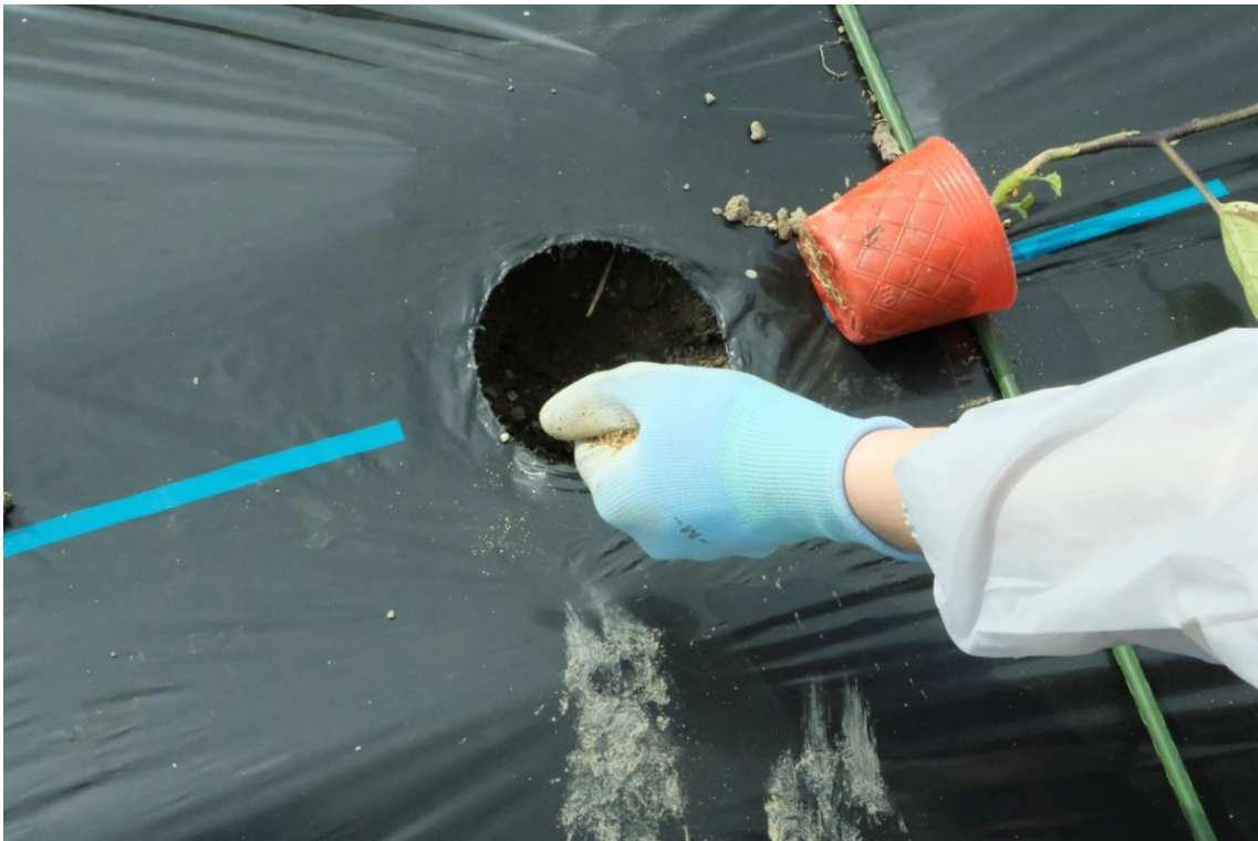
写真 13 植付用の穴を掘って、ひとつかみ肥料を入れます。