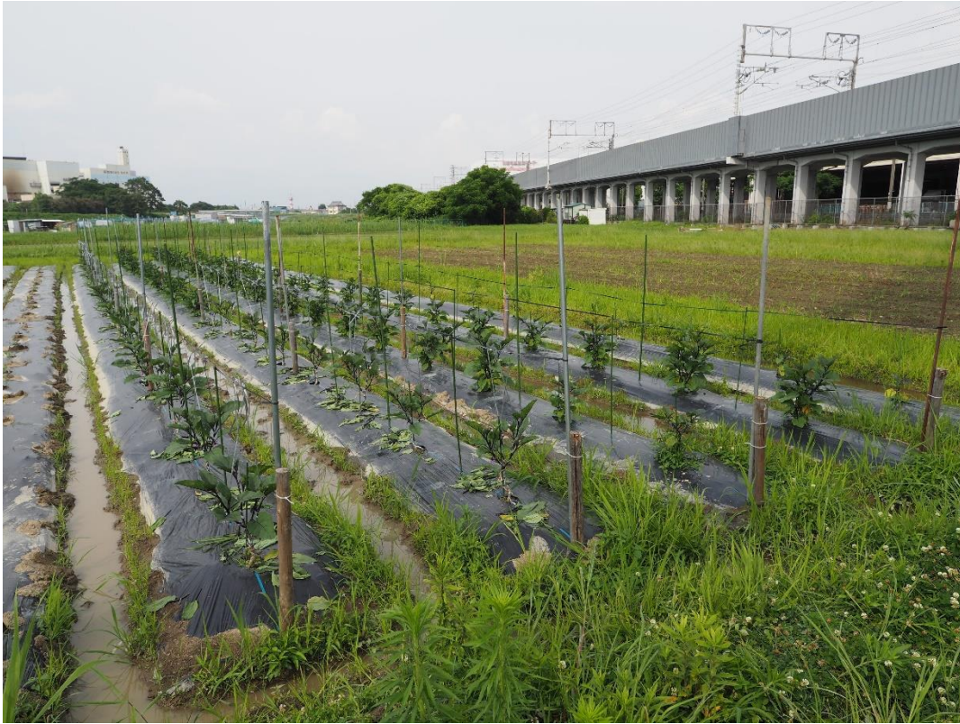
写真 11 とりあえず、2列を終えました。次はいよいよ収穫です。