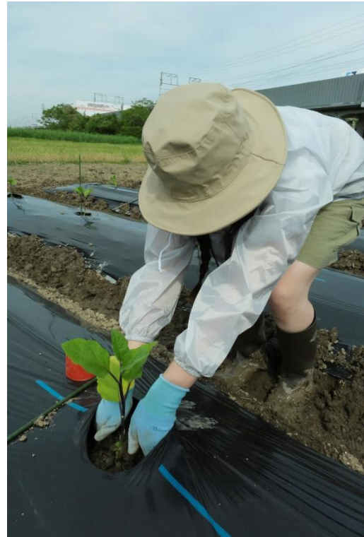
写真 16 両脇から土を寄せます。