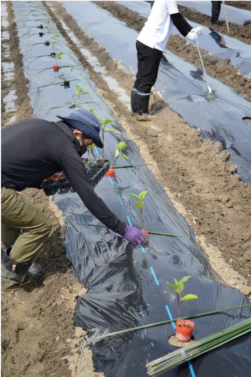
写真 12 次に苗の植付の準備をします。