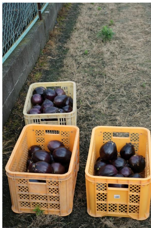
写真15 2時間でコンテナ3ケースを収穫しました。