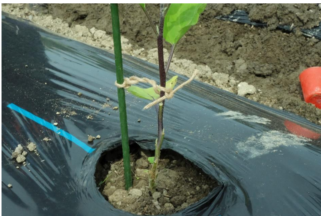
写真 20 苗を結んだら完成です。