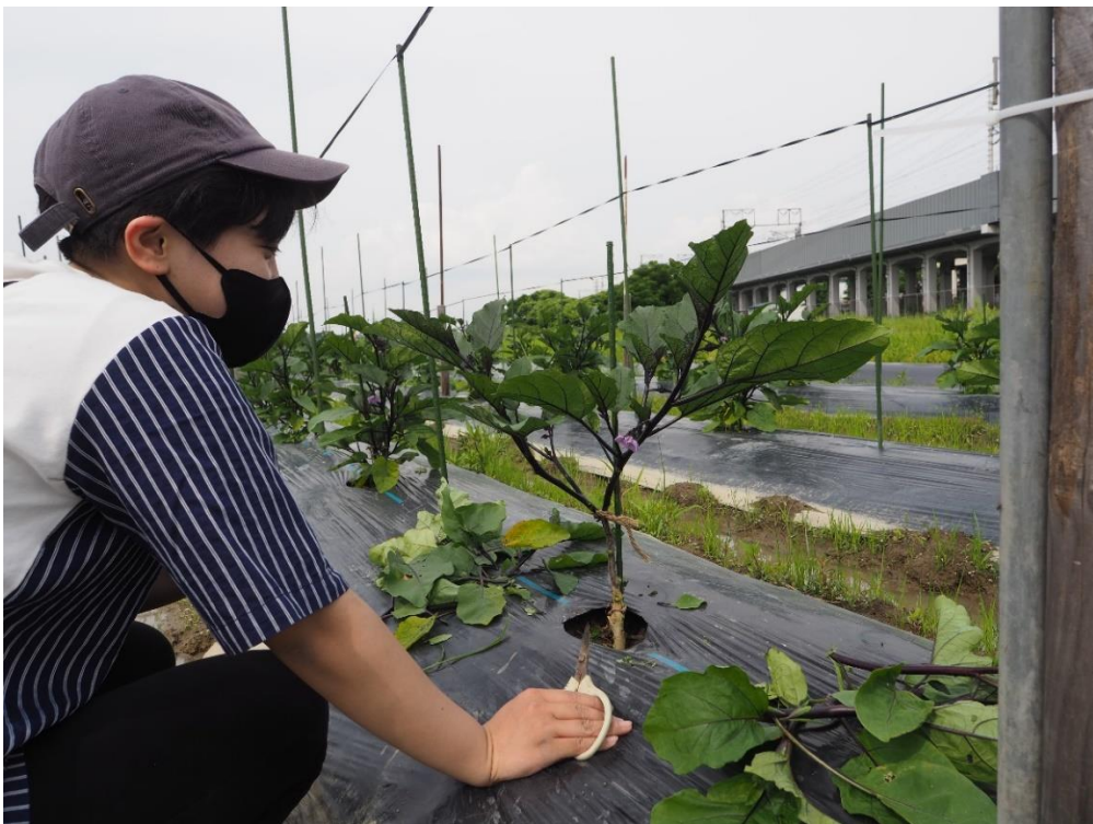
写真10 どこを残そうかな？