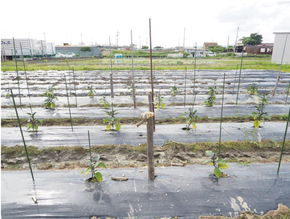
写真8 杭がボロボロです。