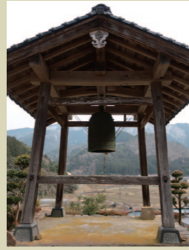
E. 臨向禅寺 梵鐘が宙に浮かんでいるみたい。 絵になる梵鐘。大空に向かって幸せな 音が響きそう。