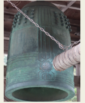
10. 両松寺 両松寺の梵鐘は豊臣時代に明延鉱山 で産出した銀・銅で作られたもの。 歴史のある重みのある音が聞か らうなあ。