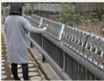
12. メロディ橋 順番に叩いていくと「さくら」のメロディ が。大屋にかかる橋、全部をメロディ橋 にできないかなあ。