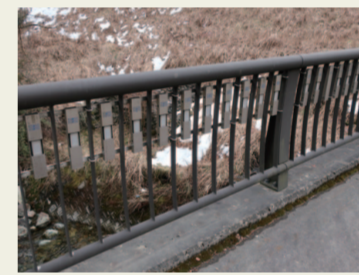
14. メロディ橋 順番に叩いていくと「ふるさと」の メロディが。橋だけに端から叩いて ください。