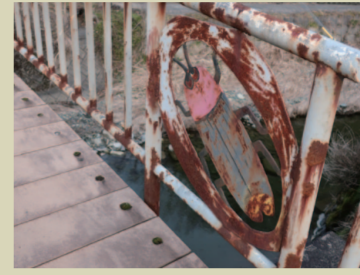
A. 橋の欄干のホタル ホタル、でかっ。車のヘッドライト ぐらい明るいんちゃうの？ でも、眼下を流れる清流に納得。 そらでっかいのやる。