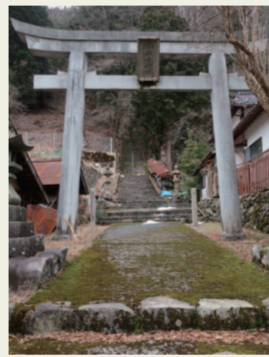
11. 和田神社 思わず上がりたくなる石段。でも、 トロッコ軌道内を跨ぐため、現在、 神社本殿へ詣でることはできません。 残念。でも、詣でることができな いことが、より一層、その神聖性を高 めているような気が。そう思うのは私 だけかな。