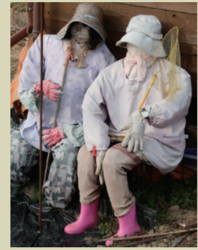
かし D. リアルな案山子 「こんにちは」って案山子か。えっ、 おばあちゃん？案山子？おばあちゃん？ 案山子？どっち？