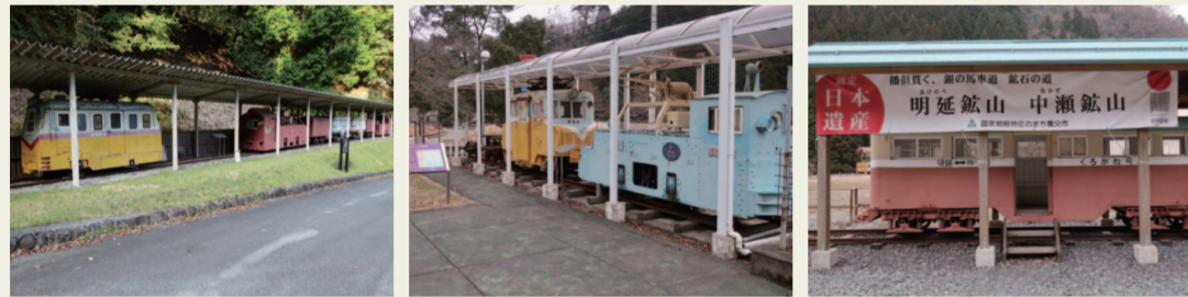
3-1,3-2,3-3. 明神電車(一元電車) 明延～神子畑間で運行。鉱石だけでなく、客車での運行も。運賃一元にちなんで「一元電車」と呼ばれ、 親しまれたそうである。でも親しまれたのは「一元」という要素だけではなく、見た目のかわいらしさにも あると思う。私とどっちがかわいい？ごめんなさい。多分、私の方がかわいいと思う♡