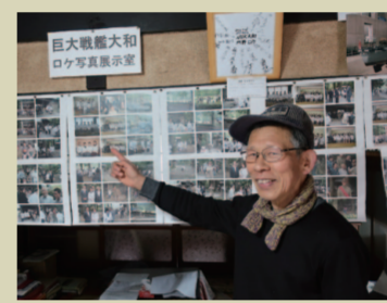
C. 大和ミュージアム 突然のミュージアム。大丈夫かなあ？ 恐る恐る建物の中へ。 入って安心。館長の貴重なお話を聞く 事ができます。