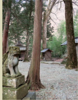
H. 萱森神社 大屋に鎮座する神社は、ほぼほぼ、 トトロの世界観。あと、バス停もね。