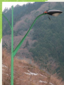
13. ホタルの電灯 ホタルが空を飛んでいる！こっちの みずは甘いぞ。