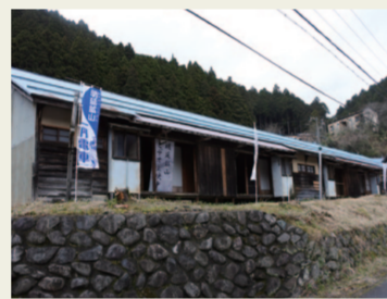
15. 北星社宅 鉱山従事者の社宅跡。最盛期には 4,000人以上が生活していたらしい。 鉱山の繁栄ぶりが想像できる。兵(つ はもの)どもが夢の跡って感じの少し さびしい気持ちと日本を支えてくれ たんだらうなあという感謝の気持ち が入り混じる。