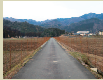
F. 両側田んぼ道 自転車で走り抜けると爽快！ そうかい？