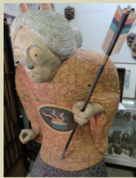
J. 但馬木彫 ここから多くの木彫作品が誕生。 運が良ければ見せていただけるかも。