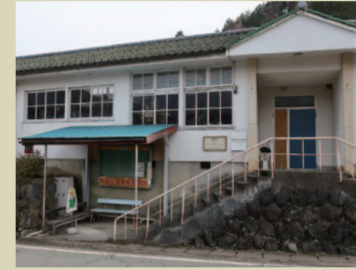
B.GOCCO (ごっこ) かつての保育所がお洒落なカフェに 大変身！こんな風に大事に活用され ると、保育所だった建物もきっと喜 んでいると思う。カフェ＆ランチは ココ！