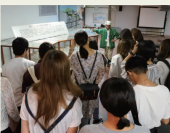
2. 学習館 明延鉱山のことを学ぶ事ができる。 ガイドさんの話も興味深いです。私 たちがお話を伺ったガイドさんは 「もう一度、鉱山で働きたい」とおっ しゃられていました。私は鉱山は 重労働なので二度と働きたくないと 思っていると考えていました。意外 でした。私は新しい知見を得ました。 大屋では、本当に多くを学びました。