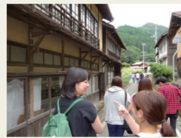
9. 面影の残るまちなみ 一度、歩いてみてください。とにかく、 歩いてみてください。歴史が聞こえて きますから。