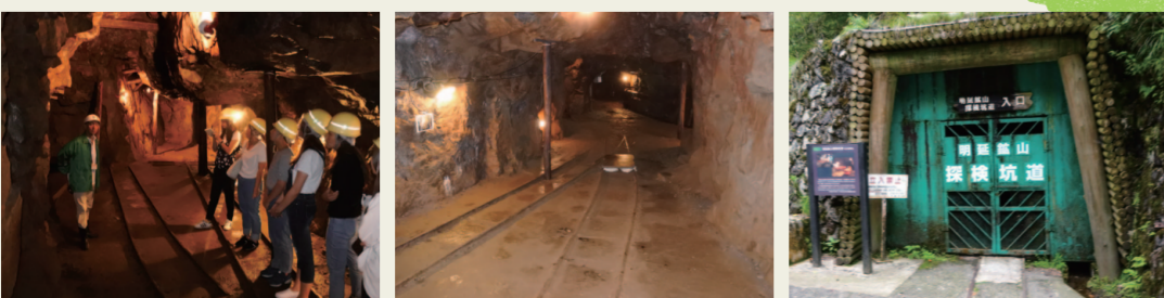
1. 坑道探検 実際に坑道を歩くことができる。とても貴重な体験。そして少し冒険。「養蚕」に「鉱山」、大屋をめぐる「知」が 満たされる。ところで、先生はハリソン・フォードのインディージョーンズを思い出すとおっしゃられていた けど、インディージョーンズって？わたしたち平成生まれ。なお、銘酒「仙櫻」はこの坑道内で熟成されたお酒。