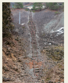
4. インクライン跡 その規模。急傾斜。見る者は圧倒さ れる。日本遺産の認定を受けるが、 インパクトは世界遺産級！絶対見て！