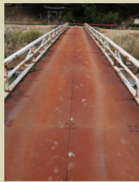
I. 清所神社 この架け橋を渡ると清所神社。気持 ちの高鳴りは、鉄板で作られたこの 架け橋を歩く際の足音に表現される。 私、小説家になろうかな？