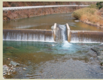
せき G. 堰 大自然に人工構造物。自然の中で 人が生きていくって、結局、何か つらくないと困難なの？ うへん。考える。我思う、故に我在り。