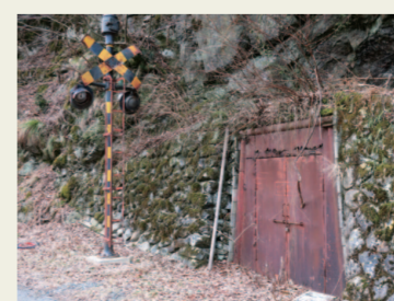
5. 踏切跡 今にも「カンカンカン」と聞こえて きそう。少しノスタルジックな感じ。