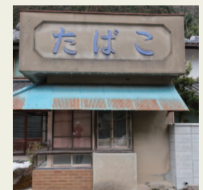
8. たばこ屋さん なんとも言えないレトロ感。ここで 多くの人がたばこを買ったんだらう なあ。吸いすぎ注意！