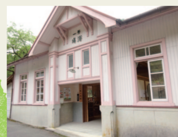
7. 旧明盛共同浴場 見た目はレトロな建物！機能は博物館！その名は旧明盛共同 浴場【第一浴場】！お湯に、ざっぱっ〜ん。「あ〜最高〜」と いう鉱山労働者のみなさんの声が聞こえてきそう。それは、 それは、気持ちよかつただらうなあ。 ♪ いい湯だな、いい湯だな。ここは但馬の明延鉱山の湯