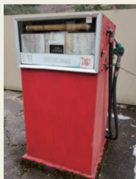
16. ガソリンスタンド アメリカ映画に出てきそう。カッコイイ！