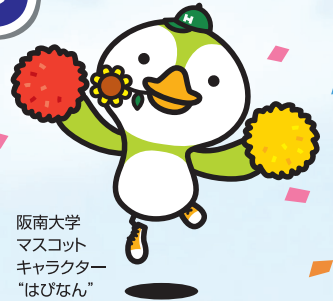
阪南大学 マスコット キャラクター “はびなん”

「子どもたちに、生涯を通じて色々なスポーツを楽しんでもらいたい!」という思いから、子どもがあびながらのびのびと体を動かせるプログラムをご用意しました。