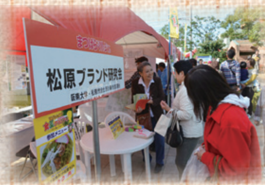
まつばらマルシェ