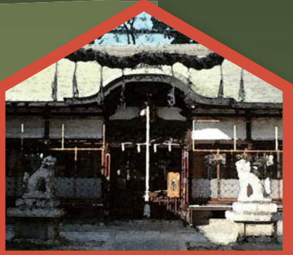
Amamikoso Jinja 阿麻美許曾神社