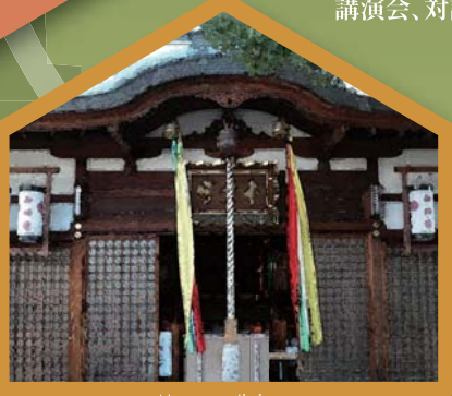
Nunose Jinja 布忍神社