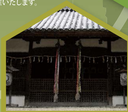
Shibagaki Jinja 柴籬神社