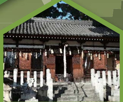
Ao Jinja 阿保神社