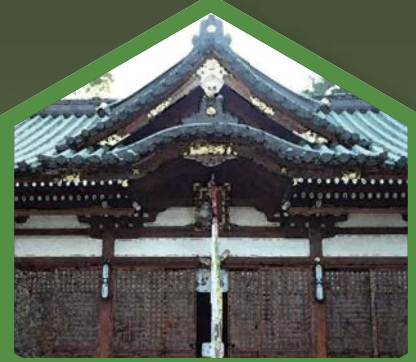
Miyake Jinja 屯倉神社