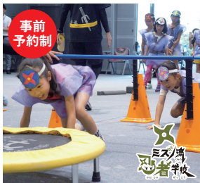
ミズノスポーツ サービス株式会社

忍者になりきって楽しく体を動かそう！「走 る」「跳ぶ」「投げる」など幼少期に必要な動 作を取り入れた運動遊びプログラムです。