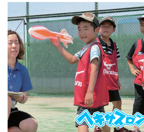
ミズノスポーツ サービス株式会社

「エアロケット」「エアロディスク」「ソフト ハンマー」などを使って、走ったり投げた り遊びの中で思い切り体を動かそう！